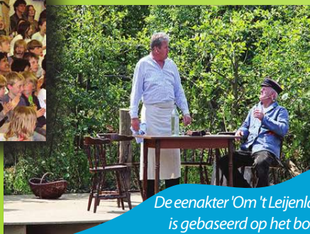
De eenakter 'Om 't Leijenlân' is gebaseerd op het boek 'It Lijen yn de Leijen' van J.T. de Jager.